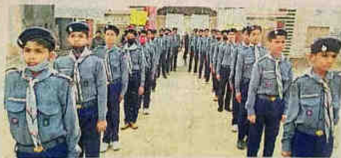
तेड़ा गांव में चौरी चौरा शताब्दी दिवस पर प्रभात फेरी निकालते विद्यार्थी