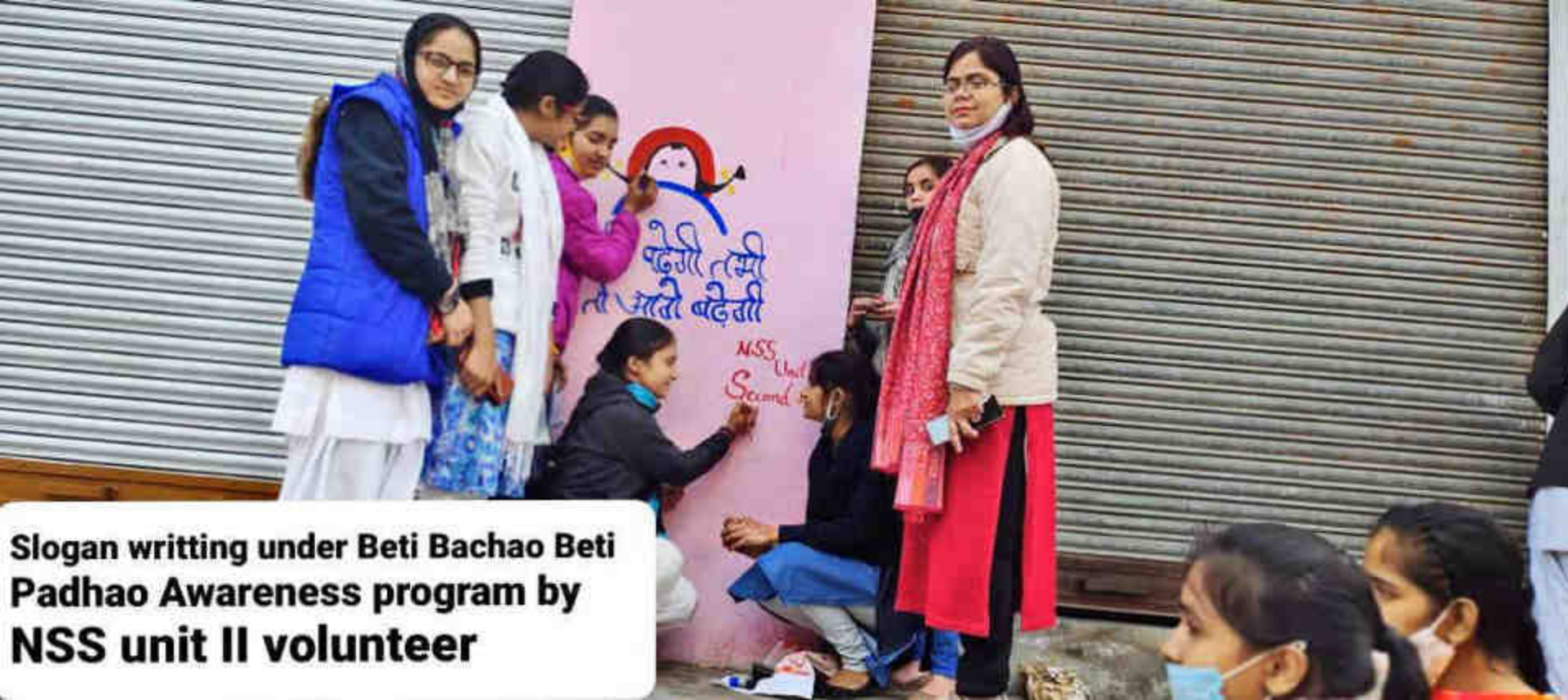
Slogan writing under Beti Bachao Beti Padhao Awareness program by NSS unit II volunteer