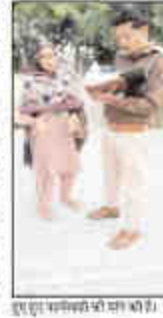
शराबी बेटे ने मां-बहन को मारपीट कर घर से निकाला

शराबी बेटे ने मां-बहन को मारपीट कर घर से निकाला... पुलिस को सूचना मिली, तब ही... बोरे में शराबी बेटे ने मां-बहन को मारपीट कर घर से निकाला