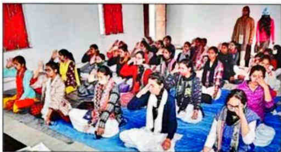
दयानंद बाल विद्या मंदिर में योगाभ्यास करती छात्राएं।