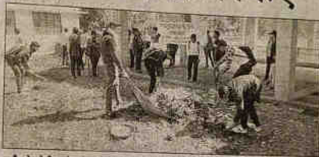
बड़ौत के जेबी कॉलेज के रासेयो की प्रथम इकाई के शिविर में सफाई करते छात्र।