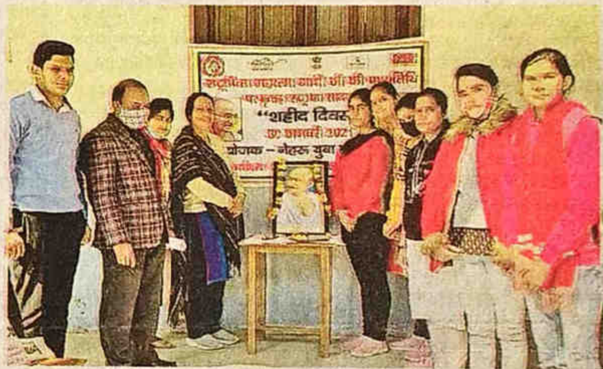
जनता वैदिक डिग्री कालेज में महात्मा गांधी की पुण्यतिथि मनाते शिक्षक और छात्राएं