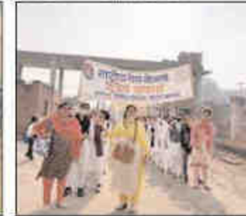
डीएम ने हरी झंडी दिखाकर... 12 हजार विद्यार्थियों ने चलाया जागरूकता अभियान