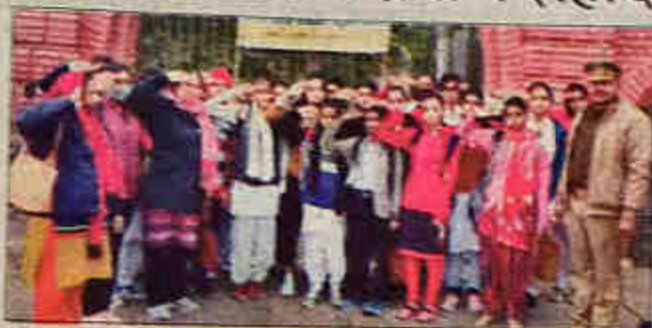
दोरी-गंगा सहाय्यी से रैली निकाली जा रही है।

दोरी-गंगा सहाय्यी समारोह के अन्तर्गत विभिन्न प्रशिक्षणियों के माध्यम से इस ऐतिहासिक घटना से दूर शहीदों को और गांधीजी से जुड़ाव को स्वयं करवाया गया। यह रस अकादमी के अधीन में परिचालन की गई होगी। घटना के दौरान 22 शिक्षक वर्गों की जनसंख्या थी जो उनके 32-37 लोगों को फार्मों को सजा सुनाई