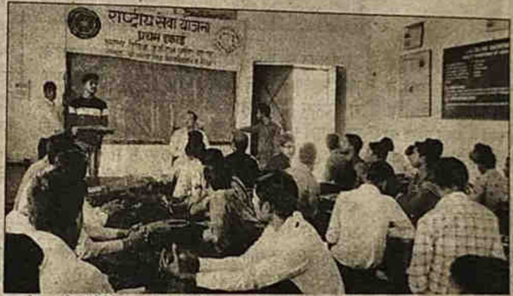
कार्यक्रम को संबोधित करता स्वयं सेवक।