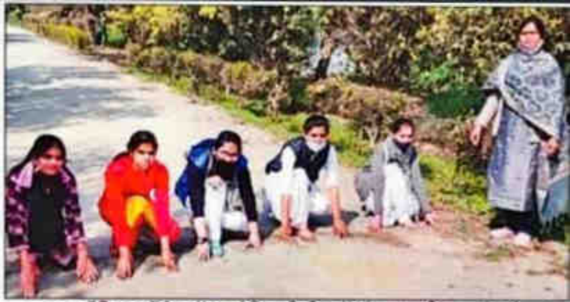
जनता वैदिक कॉलेज में आयोजित शिविर में दौड़ लगाती छात्राएं। संवाद