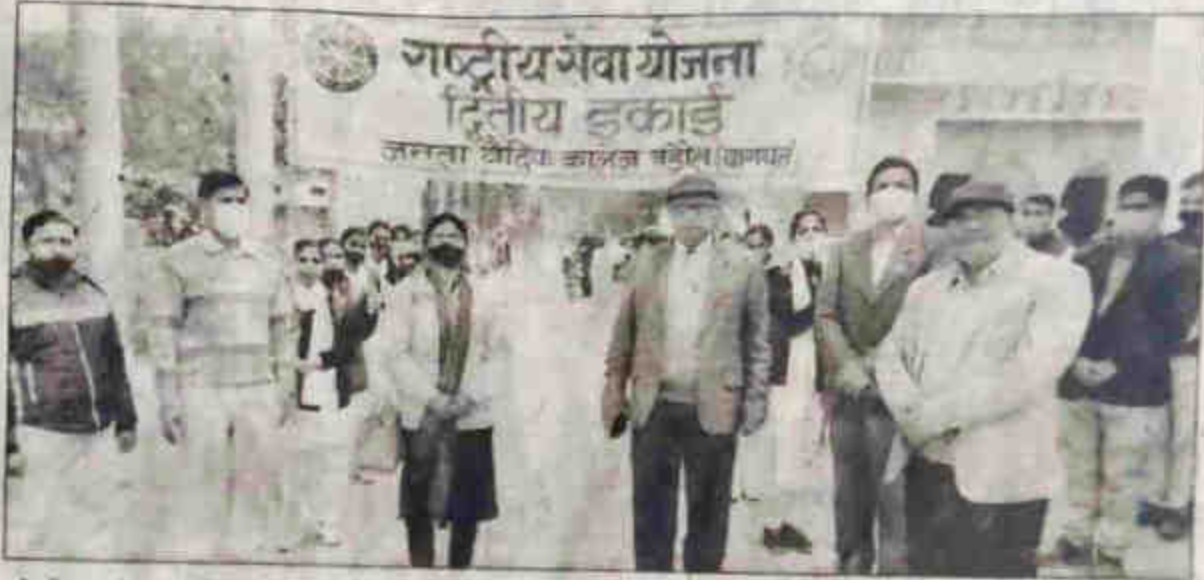
जेवी कॉलेज से रैली निकालते एनएसएस छात्राएं।