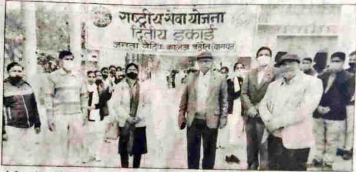
जेवी कॉलेज से रैली निकालते एनएसएस छात्राएं।