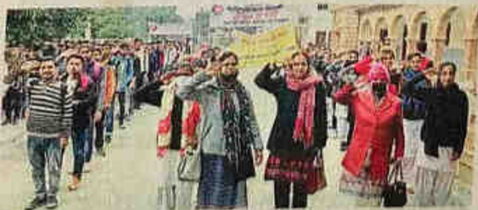
बड़ौत के जनता वैदिक कालेज में सलामी देती शिक्षिकाएं व छात्र-छात्राएं • जागरण