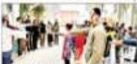
छात्राओं ने विवेकानंद के चित्र पर पुष्प अर्पित कर नमन किया

विवेकानंद की जयंती को मनाया गया। छात्राओं ने विवेकानंद के चित्र पर पुष्प अर्पित कर नमन किया।