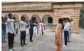
जयन्त वैदिक कॉलेज में सरदार को सत्यम मिलाने हुए शिक्षक

जयन्त वैदिक कॉलेज में एम पीए युनिटी और सत्यम प्रथम समारोह का आयोजन