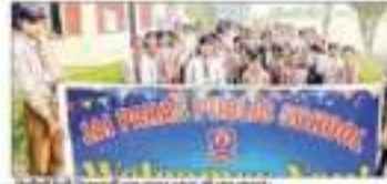
बड़ौत में जयंती समारोह में सांस्कृतिक कार्यक्रम।