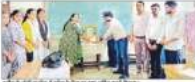
बड़ौत के जयंती समारोह में सरदार पटेल का स्मरण किया गया।