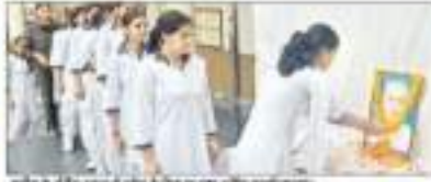
बड़ौत के जयंती समारोह में छात्रों के द्वारा सांस्कृतिक कार्यक्रम।