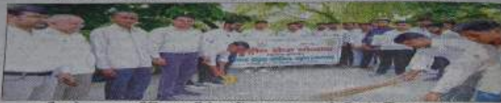
बड़ीत के जनता वैदिक कॉलेज में अमदान करते विद्यार्थी। अंतर - शिखर